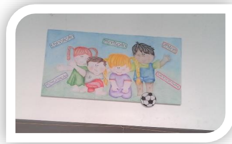
Painel "Os Direitos das Crianças"