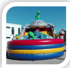
Dia Mundial da criança - Insufláveis