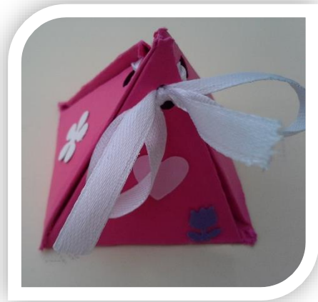
Caixa de embrulho do presente para a Mãe