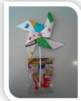
Dia Mundial da criança - Moinho de vento