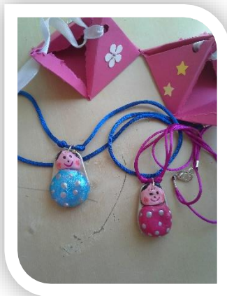
Dia da Mãe - Fio de pasta de moldar