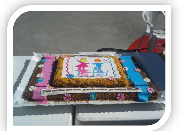
Bolo da Associação de Pais