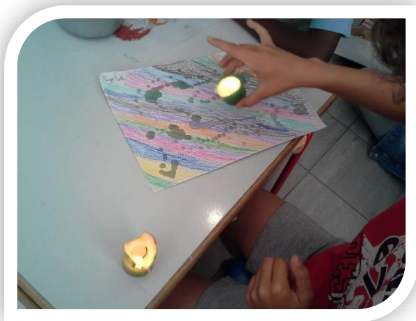
Digitintas com velas