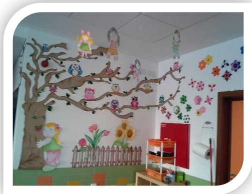
Decoração do nosso espaço