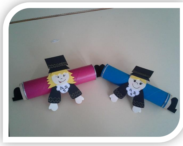
Diplomas para os finalistas